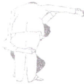
FIGURA 6 Posizione intermedia