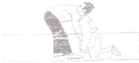
FIGURA 5 Posizione iniziale