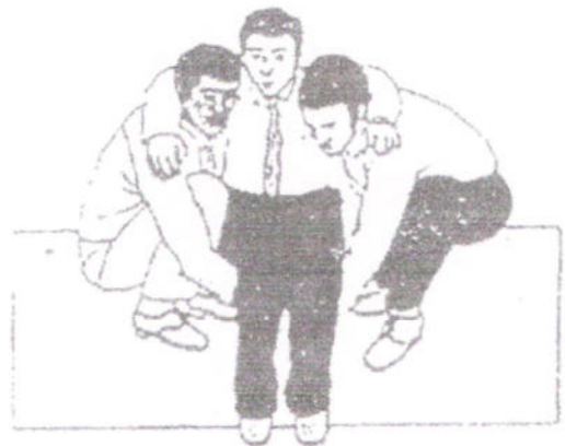
FIGURA 9 Posizione finale