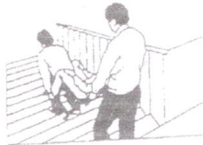
FIGURA 12 Posizione finale