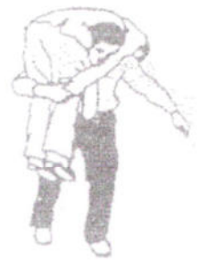
FIGURA 7 Posizione finale