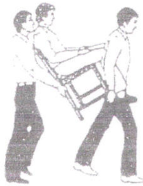
FIGURA 11 Posizione intermedia