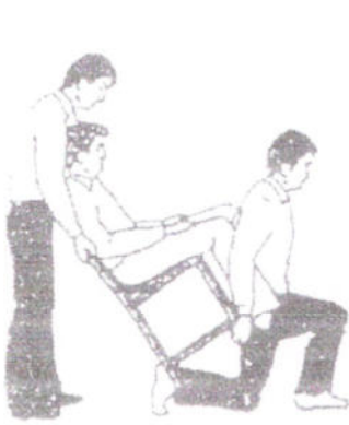
FIGURA 10 Posizione iniziale